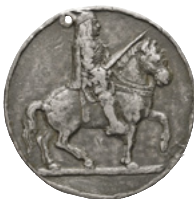
17 - Foto rid. 70%