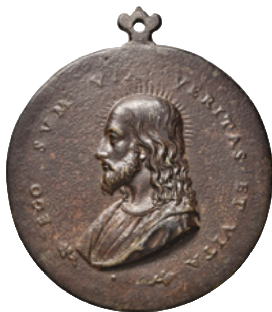
18 - Foto rid. 70%