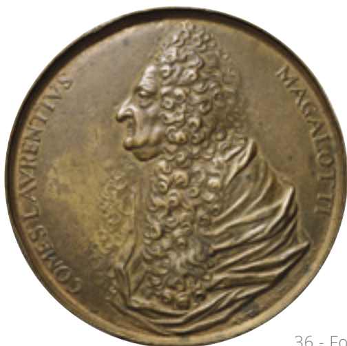
36 - Foto rid. 70%