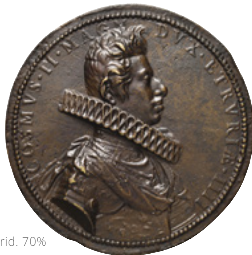
33 - Foto rid. 70%