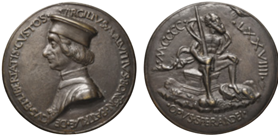
15 - Foto rid. 70%