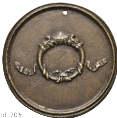
34 - Foto rid. 70%