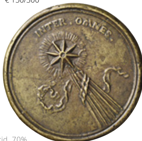
35 - Foto rid. 70%